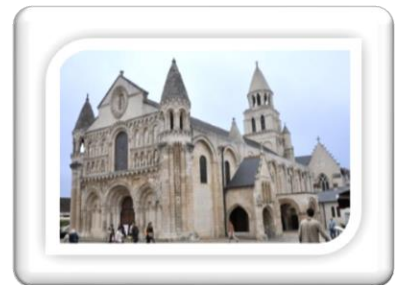
Notre Dame le Grande

Poitiers constitue le chef-lieu du département de la Vienne. Cette ville était aussi la capitale régionale de l'Ex-Poitou-Charentes. Cette position régionale importante fut permise par une importante empreinte historique. En guise d'exemple, nous pouvons citer Sainte Radegonde qui créa à Poitiers au VI e siècle la première abbaye française exclusivement féminine. Par ailleurs la ville est nommée « ville aux cent clochers » pour ses nombreuses églises. Nous vous invitons à prendre du plaisir et à flâner dans les rues et ruelles du vieux Poitiers où vous attendent de nombreuses surprises architecturales et historiques.